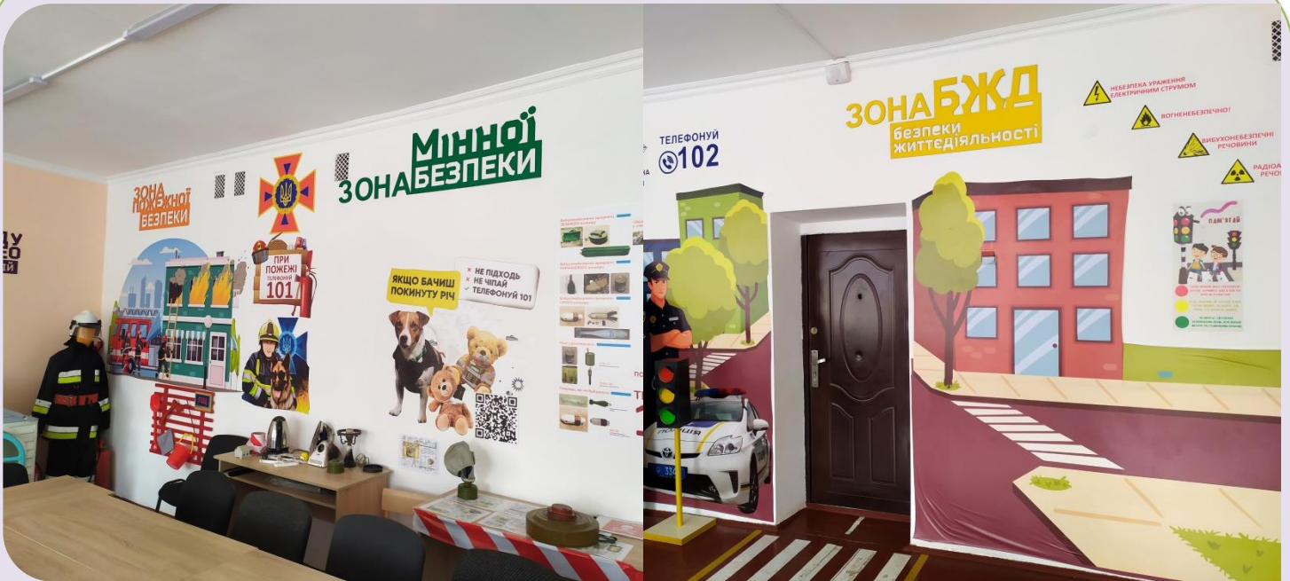
Комплект стендів для класу безпеки (15500 грн.)

Для потреб закладів освіти в 2023 році закуплено мультимедійне та інше обладнання, а саме: