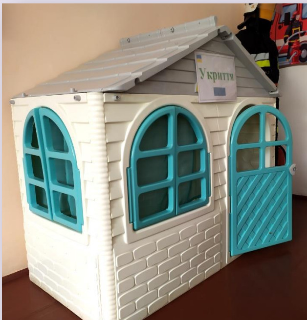
Будиночки для класу безпеки – 2 шт. (7000 грн.)