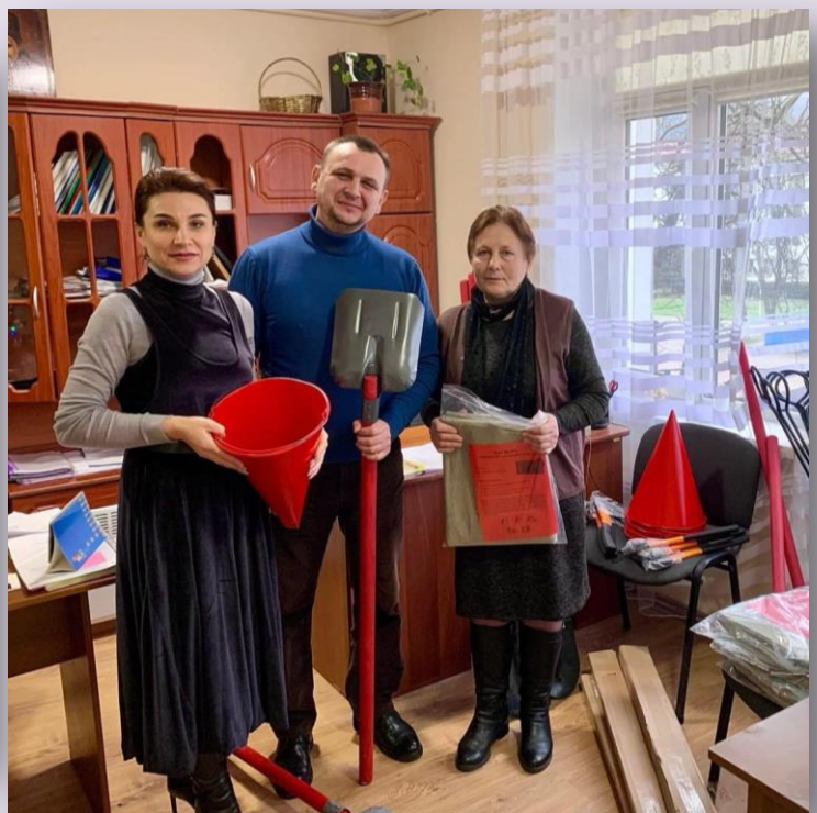
Пожежні щити - 6 шт. (21 000 грн.)