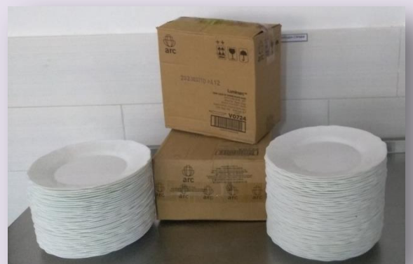
Тарілки для шкільних їдалень в кількості – 800 шт. (29 600 грн.)